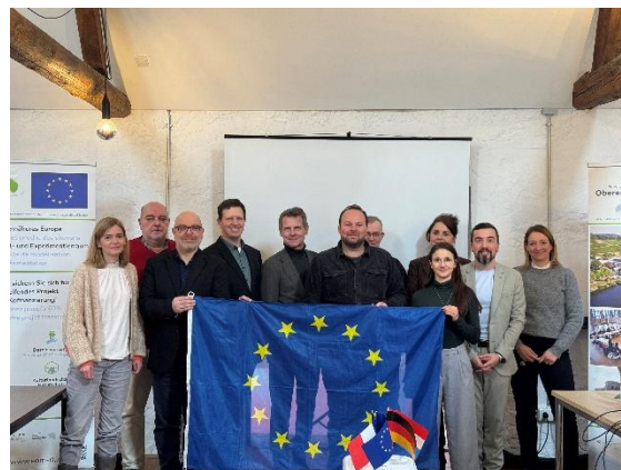
Gruppenbild des AG-Auftakttreffens in Grevenmacher.

Am 5. Februar 2026 fand im luxemburgischen Grevenmacher das Auftakttreffen der „Arbeitsgemeinschaft der grenzüberschreitenden funktionalen Räume“ statt. Gastgeber des Treffens war der funktionale Raum „Entwicklungskonzept Oberes Moseltal“.